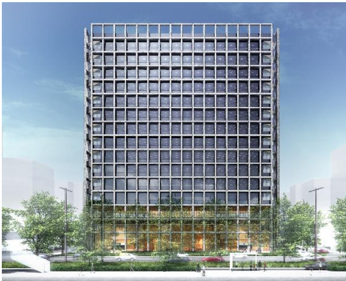
外観正面 (イメージパース)

本計画は、旧名古屋フコク生命ビル跡地と清水建設グループ所有地で構成する約4,820㎡の敷地に、延床面積約47,500㎡、16階建てマルチテナント型オフィスビルを開発するものです。2021年10月に着工し、現在、12階躯体工事、8階内装工事等を進めているところです。竣工は、富国生命の創業100周年度に当たる2024年3月を予定しています。