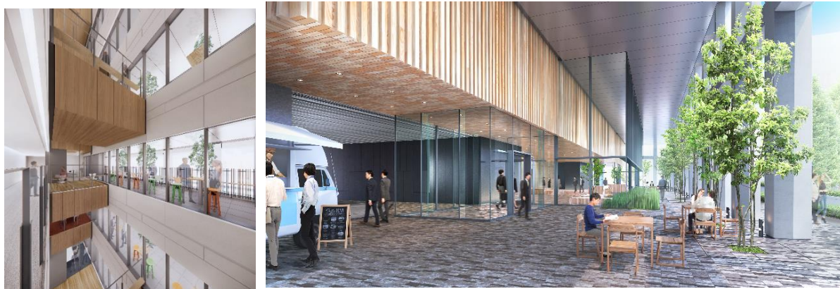
基準階共用部、1階ピロティ（イメージパース）

また、豊かな緑に囲まれた開放的なピロティには、キッチンカーの導入を予定しており、地域の賑わい創出にも貢献します。