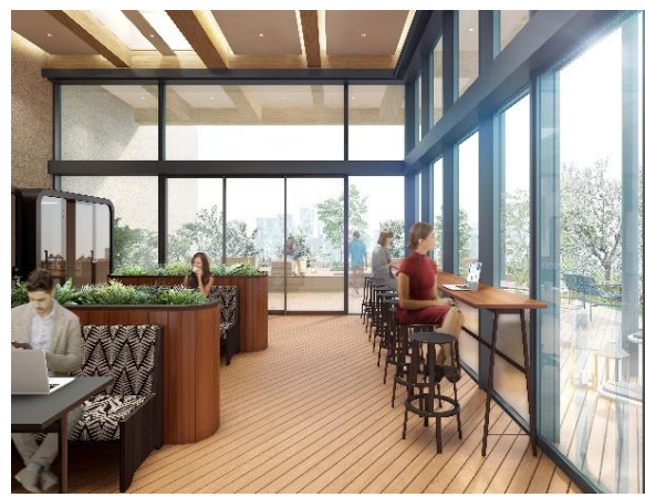
最上階ラウンジ、テラス（イメージパース）