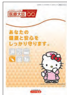
2016年4月 「医療大臣プレミアエイト」発売