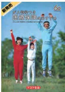
1983年9月 「医療保険」発売

1983年に医療保険を発売。以降、一貫して医療保障・生前給付保障などの第三分野に注力。