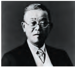
初代社長 根津嘉一郎