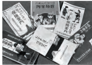
創業時の徴兵保険案内