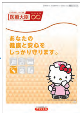
2016年4月 「医療大臣プレミアエイト」発売