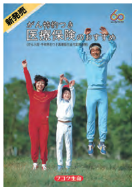
1983年9月 「医療保険」発売

1983年に医療保険を発売。以降、一貫して医療保障・生前給付保障などの第三分野に注力。